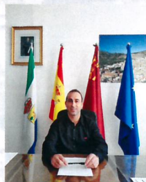
“Viva San Sebastián bendito”

Dar las gracias a la Hermandad de San Sebastián por su gran implicación en el desarrollo de las fiestas. Adoremos a nuestro patrón San Sebastián. Pidámosle que nos proteja día a día como lleva haciendo tantos años.