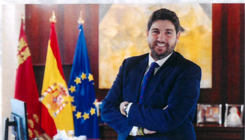
FERNANDO LÓPEZ MIRAS Presidente de la Región de Murcia

Ahora que la actual situación sanitaria nos obliga a disfrutar de grandes reuniones de acuerdo a las recomendaciones de los expertos en salud pública, os animo a hacerlo con responsabilidad y prudencia, y agradezco en lo mucho que vale la labor de cuantos han contribuido a la organización de estas Fiestas Patronales de Ricote, para las que os expreso mis mejores deseos y en las que os animo a participar con la misma ilusión y alegría que siempre.