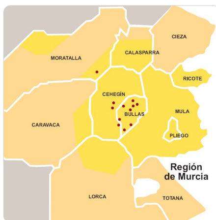
Mapa Zona Producción DOP Bullas

Las tierras de Ricote por sus características son ideales para la producción de uva que reúna las condiciones necesarias para producir vinos dignos de protección con el signo de calidad DOP Bullas.