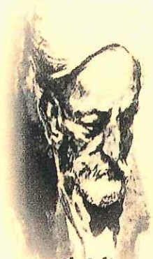
Ibn Sabin Ricote 1.217 - La Meca 1.270