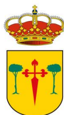
Ayuntamiento de Ricote