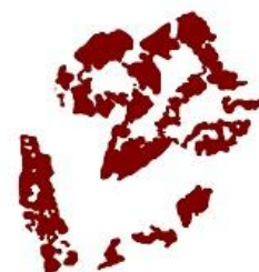
Asociación Cultural «La Carrahila»